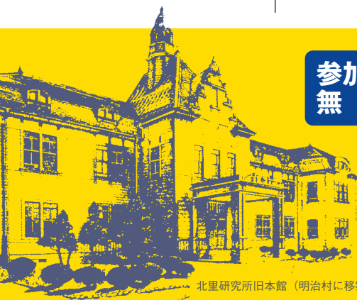
北里研究所旧本館(明治村に移築保存)